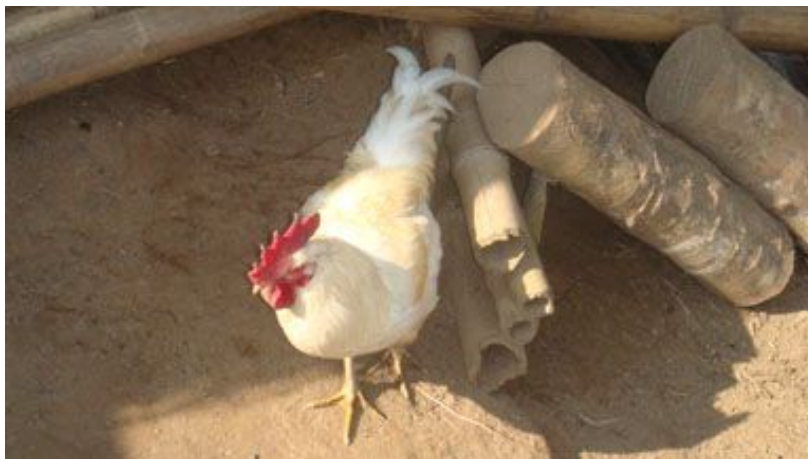
Gallo oriundo Elbano

Ho provato ad introdurre delle uova fecondate dall'Italia per farle covare da chioce di qua e farne nascere dei riproduttori di maggiore consistenza, con galletti da carne e galline piu' ovaiole.