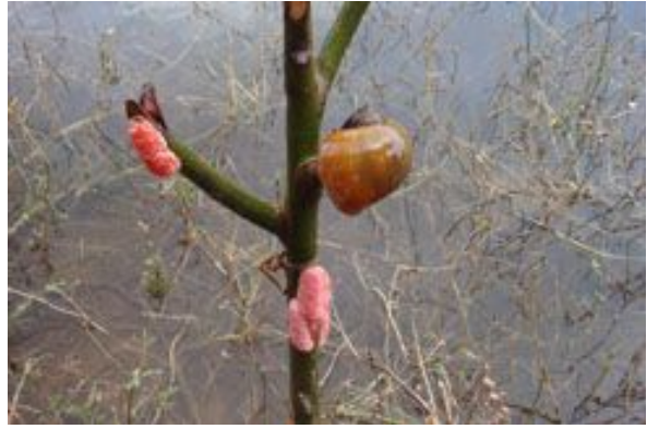
“lumachine” d’acqua dolce a destra le uova, di un improponibile rosa. Sotto Bufalo che scappa .